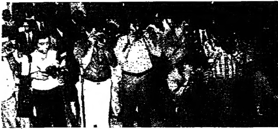
عندما استأنف المجلس أعماله